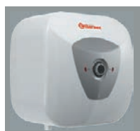
■ Design moderno