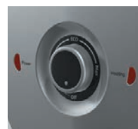
■ Controllo meccanico