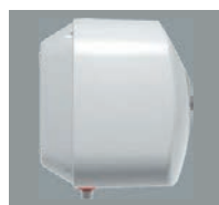
■ Resistente agli urti